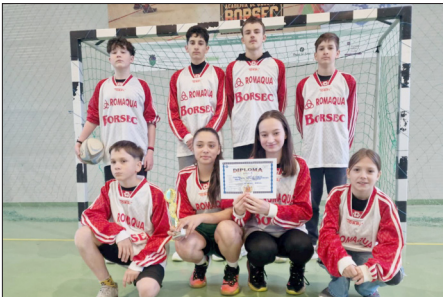
ECHIPA MIXTĂ-CICLUL GIMNAZIAL