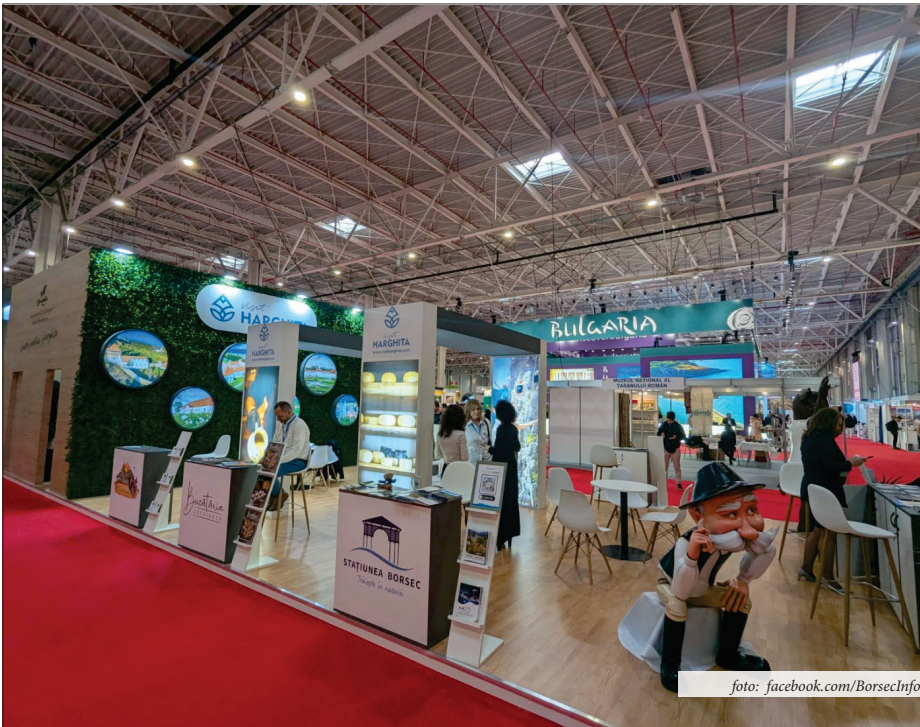
BORSEC LA TÂRGUL DE TURISM AL ROMÂNIEI

Stațiunea Borsec a fost prezentă la Târgul de Turism al României, desfășurat în perioada 20 – 23 februarie 2025, în Pavilionul B2 al ROMEXPO București, unde s-au promovat oportunitățile de relaxare și tratament, dar și activitățile recreative care se oferă turiștilor pe tot parcursul anului.