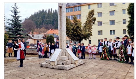
COMUNITATEA ȘCOLII LA ZIUA MAGHIARILOR DE PRETUTINDENI

În perioada sărbătorilor de iarnă, Clubul Copiilor din Toplița a organizat o expoziție de artă plastică cu 41 de lucrări, la Cinema Călimani din Toplița. La această expoziție, grupa noastră de desen din Borsek a contribuit cu 9 lucrări. Lucrările recent aduse acasă le-am amplasat pe pereții școlii. Înramăririle au fost realizate de Asociația Culturală.