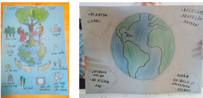
O parte din lucrările realizate de elevii Liceului Tehnologic Zimmethausen

Ziua de 22 aprilie a fost declarată sărbătoare oficială a planetei Pământ în anul 2009 de Organizația Națiunilor Unite (ONU).